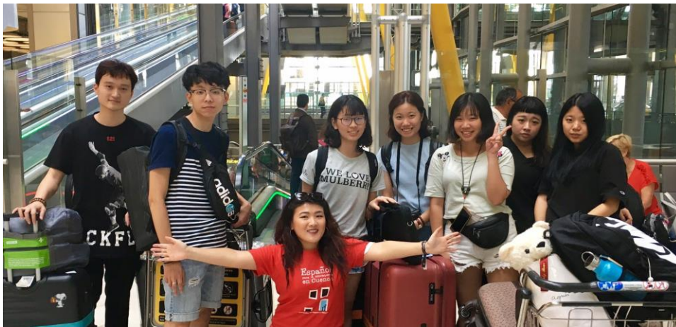
馬德里下飛機合照

大學一年級，我們的導師也是系主任，向我們宣傳了西班牙留學的機會，我想把握住也申請了，可惜計畫跟不上變化，我沒有上，可是也因為這樣我用了一年的時間慢慢接觸西文，並用寒暑假的時間密集的訓練西班牙文。大二下學期，我也如願申請上了，得到這個機會，藉此運用這個機會體驗外國生活加強外語能力，並觀看歐洲的藝術館，增進自己的對藝術的視野，希望未來都會有所進步。