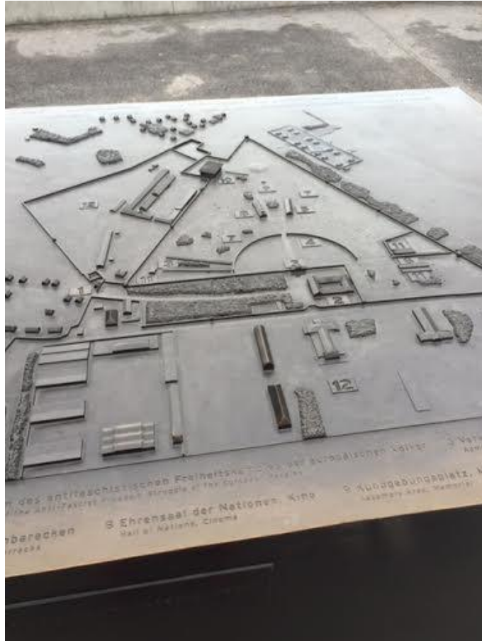
在德國參訪了集中營