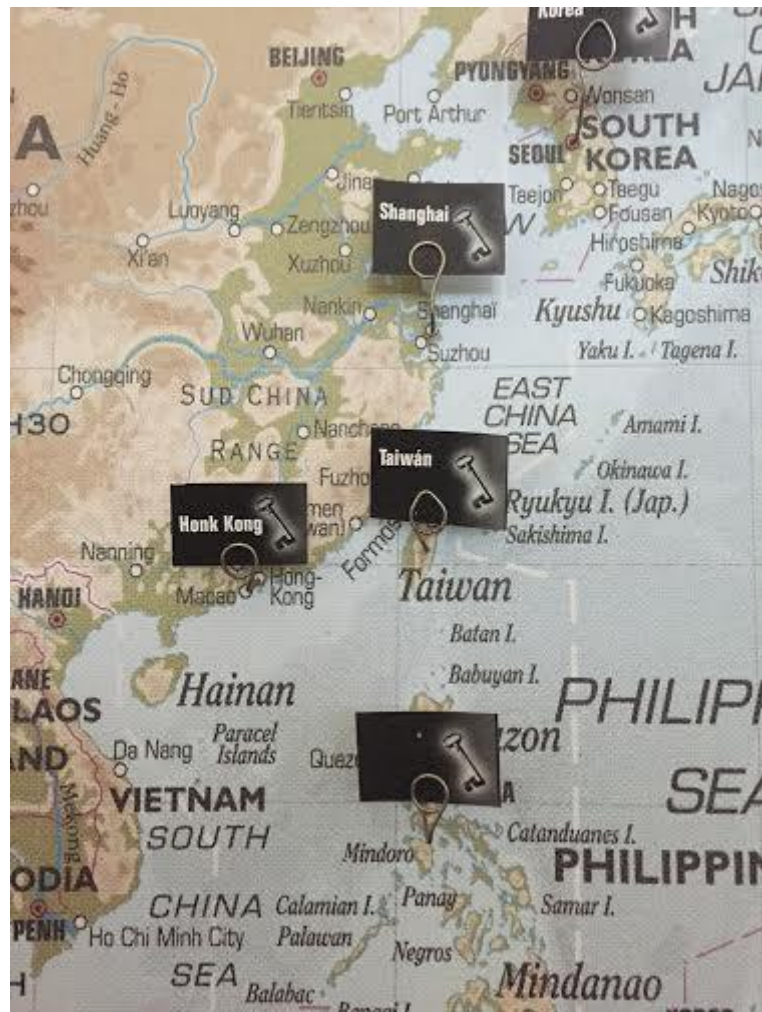
參觀酒廠，看到輸出國地圖