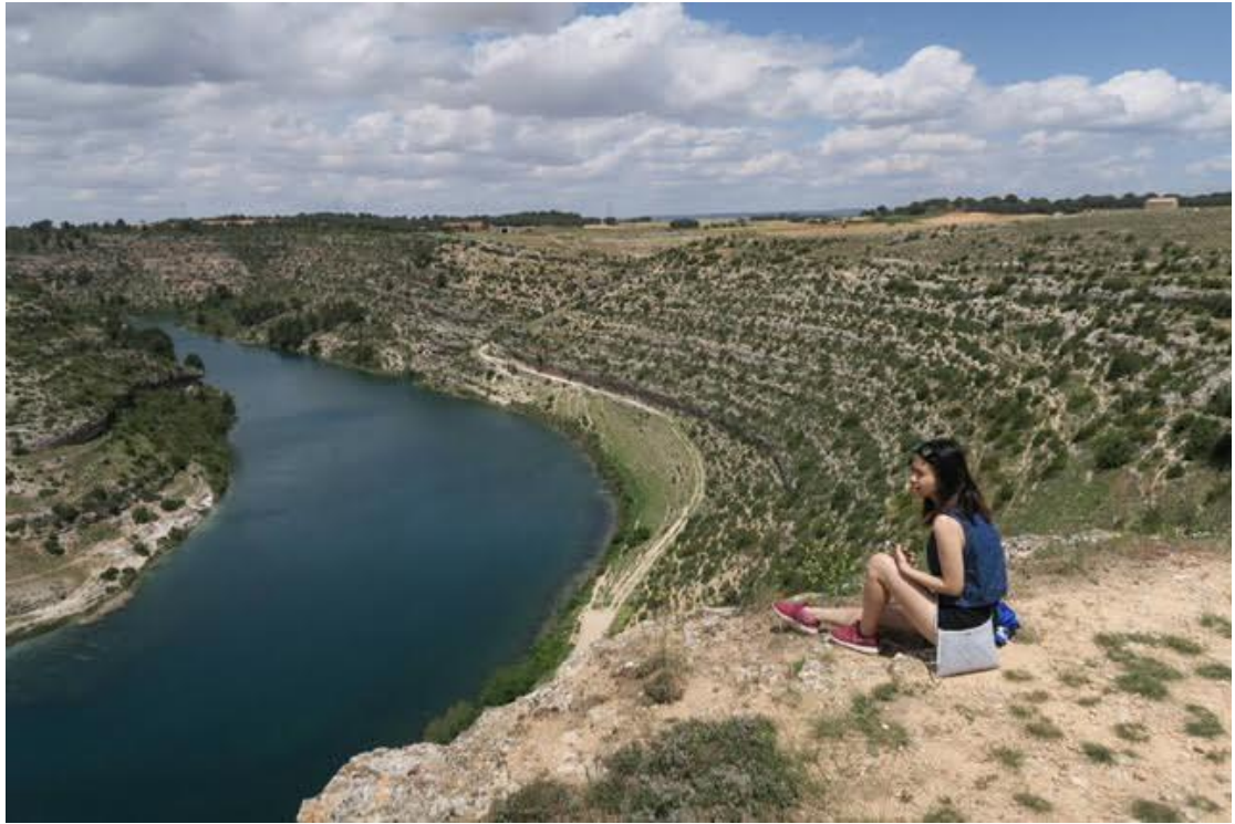
昆卡是一座高台地，很多人特別來爬山攀岩