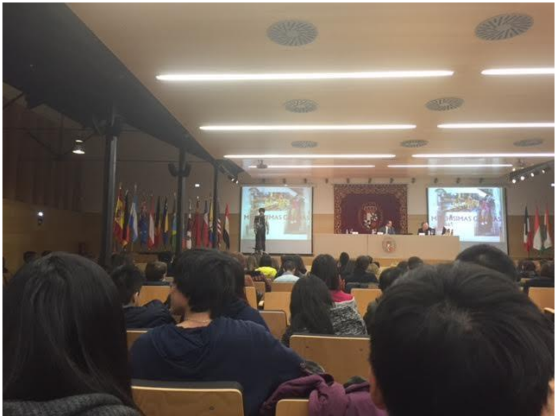
學校國際學生日，集合不同校區