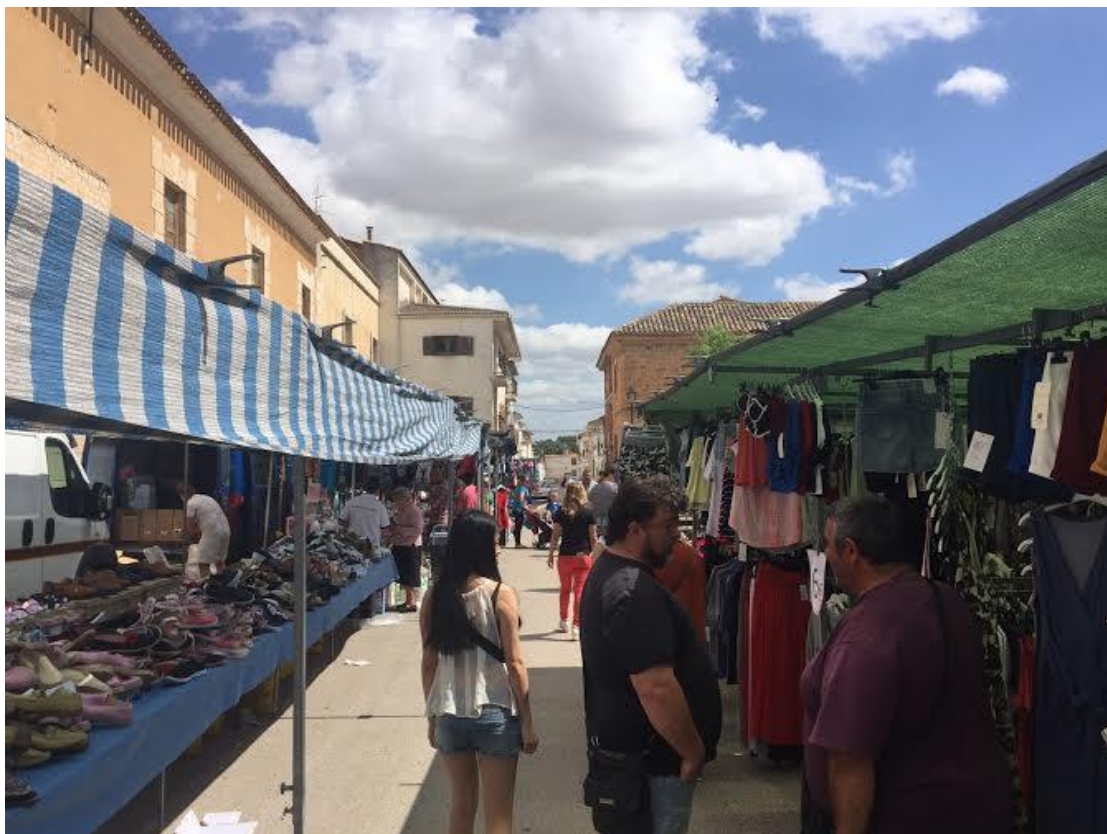
在鄉下的假日市場