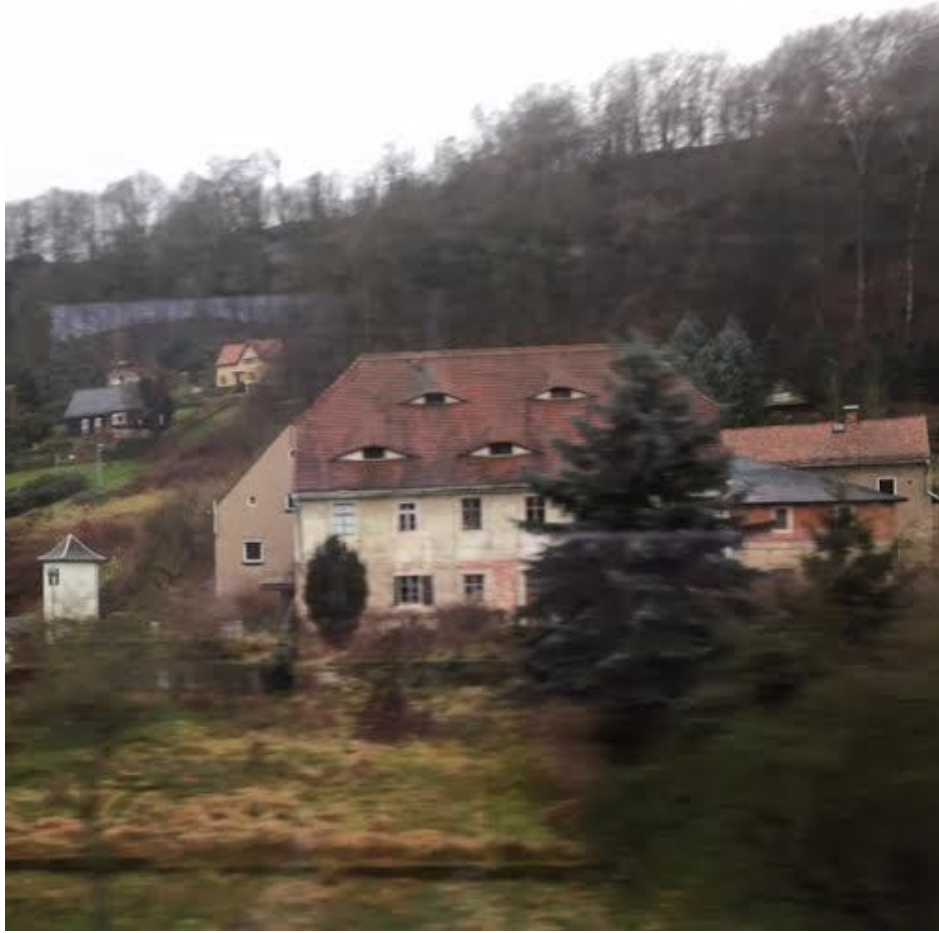
在旅行的火車上，立刻拍下長眼睛的屋頂