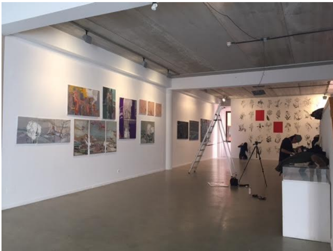
學期結束我們辦了展覽