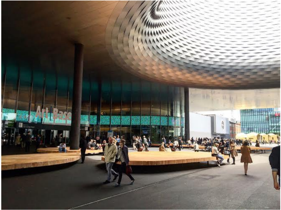
去瑞士看了「Art Basel」藝博會