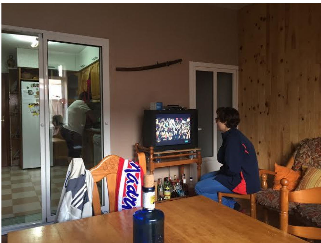
看足球重要生活之一，兩隊馬德里比冠亞軍，勝利還是在西班牙。