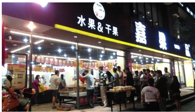
校外水果店(張老坎旁邊)