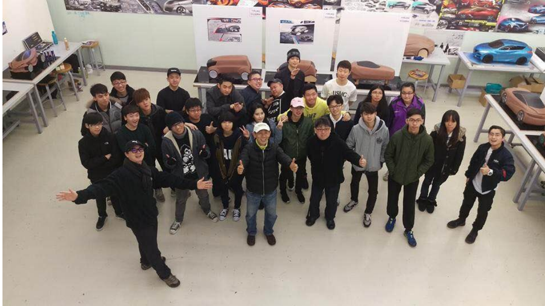
和交通組可愛的老師同學們