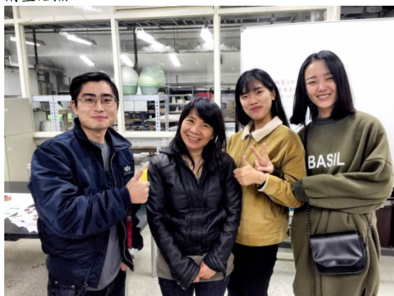
和林彩藝老師和同學們