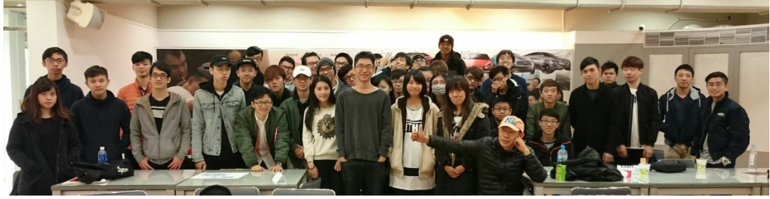
和交通組可愛的老師同學們