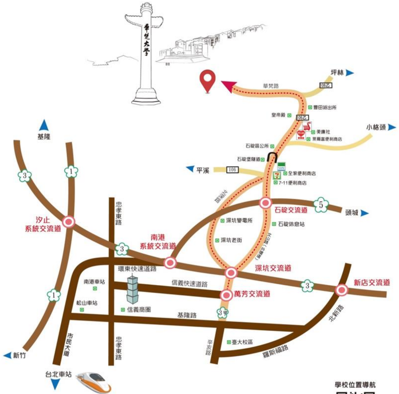
■ 華梵大學交通路線圖