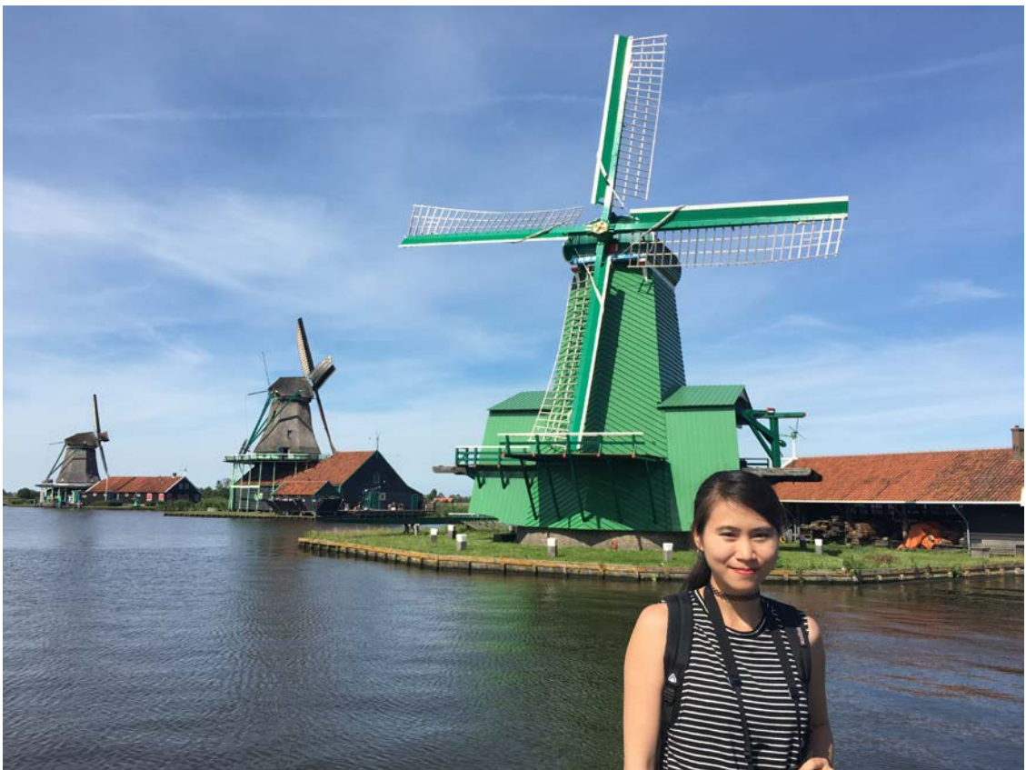
荷蘭阿姆斯特丹的風車村