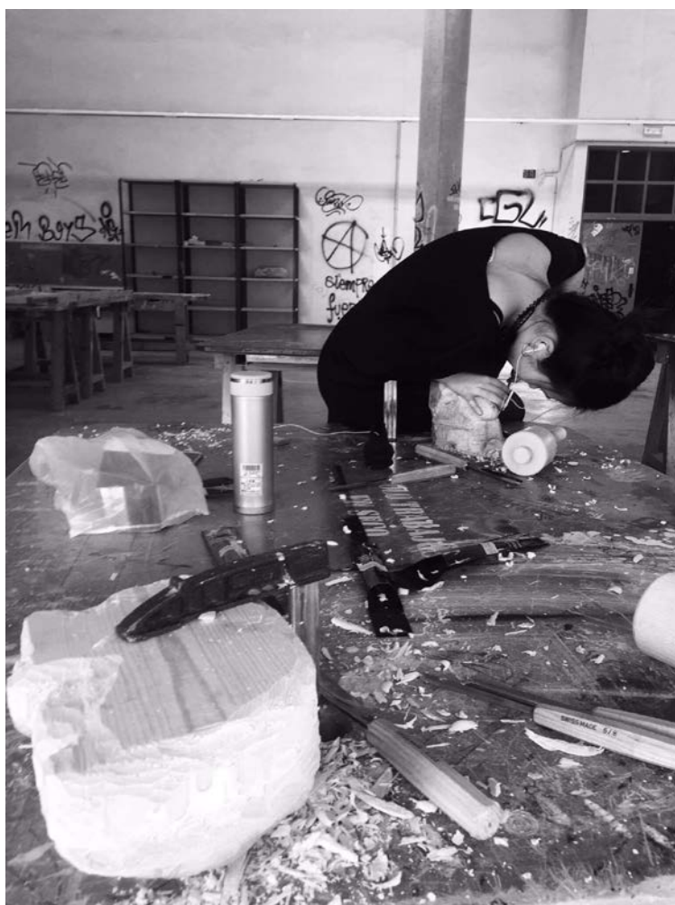
雕塑課製作作品中

另外，我參加了Espacu開設的文化體驗課，這門課的主旨是讓我們能深入體驗西班牙當地的生活、飲食、建築和文化等。我們參訪了西班牙幾個重要的景點，如：古都Toledo、世界名著唐吉軻德的故鄉、文化重鎮的國際大城Barcelona...等；進入西班牙當地的餐廳，由主廚教導我們烹煮西班牙燉飯、西班牙烘蛋……等；參訪酒廠，實際了解酒的著作過程；參觀美術館、品酒課、自然體驗課……等等。