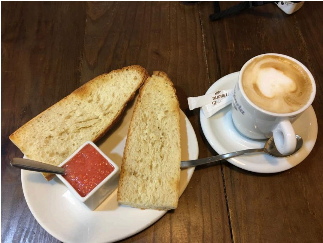
西班牙傳統早餐之一：咖啡配法國麵包塗新鮮番茄醬和橄欖油(另外一種是熱巧克力配油條)