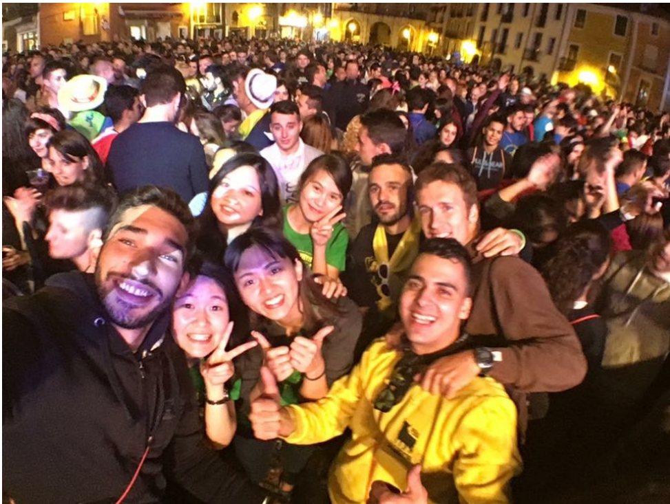
Cuenca一年一度最盛大的節慶－San Mateo