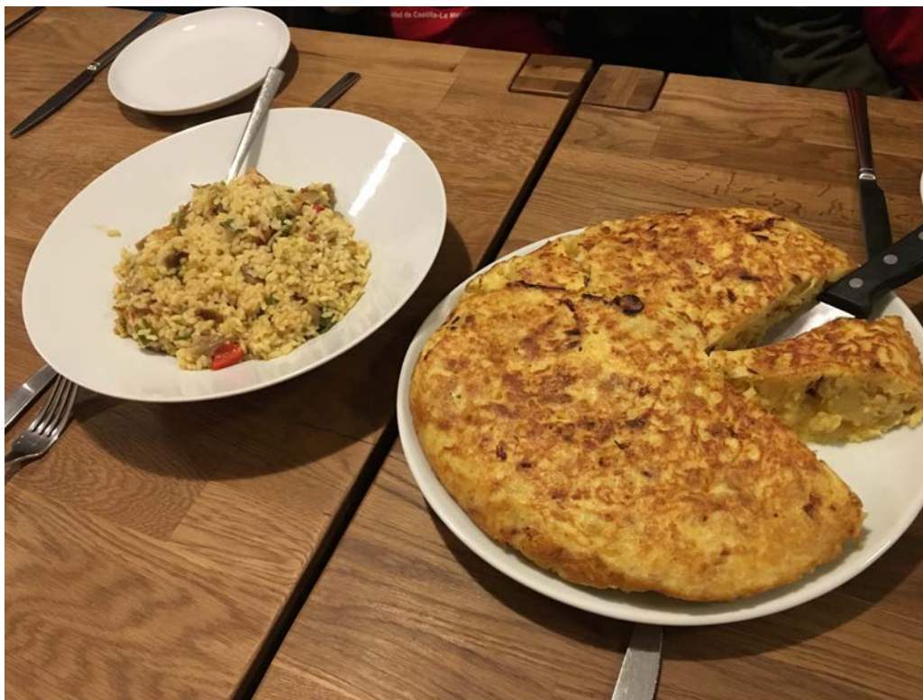
文化課—體驗烹煮西班牙傳統料理—西班牙燉飯和西班牙烘蛋