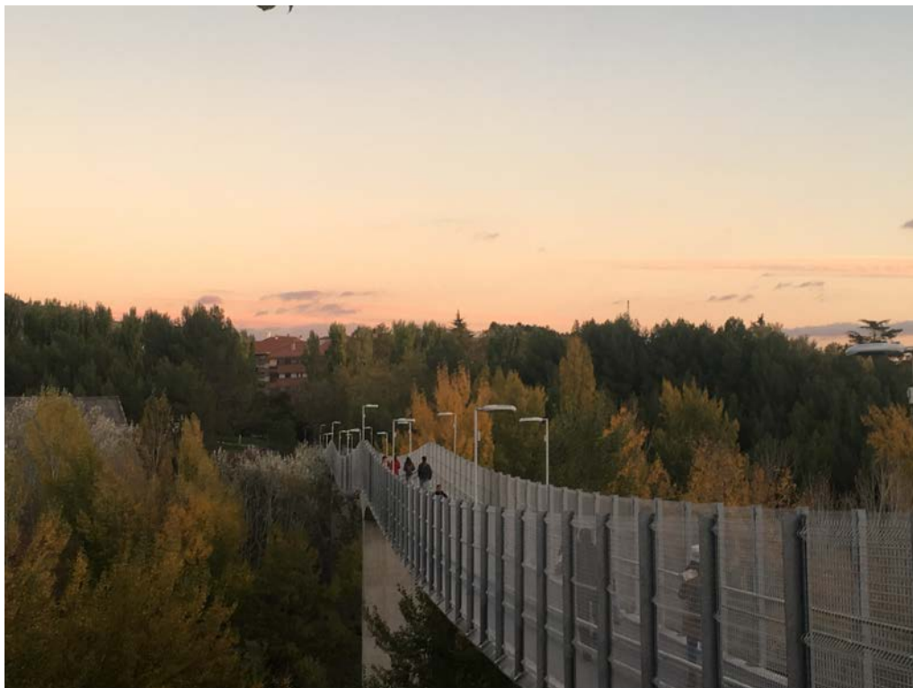
每日去學校的必經之路