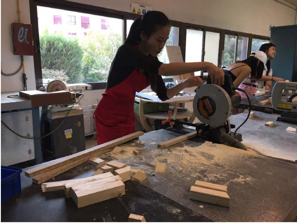
雕塑課，使用機具切割木材