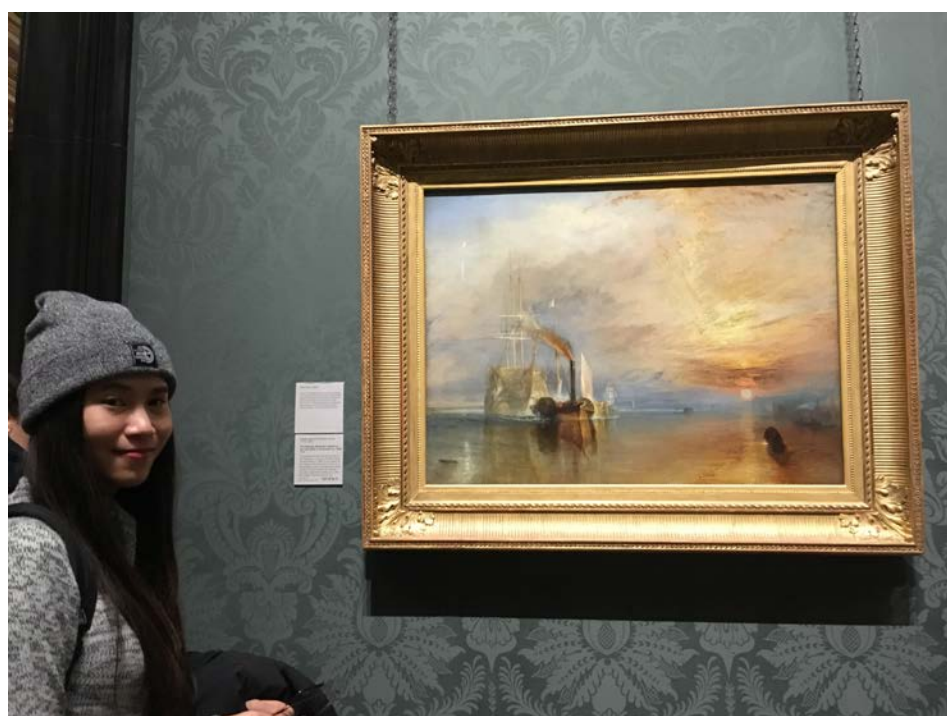
英國國家美術館，浪美主義大師泰納的真跡