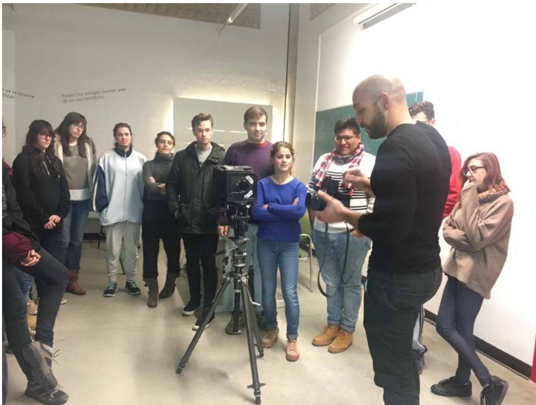
攝影課，教授正在講解底片相機如何使用