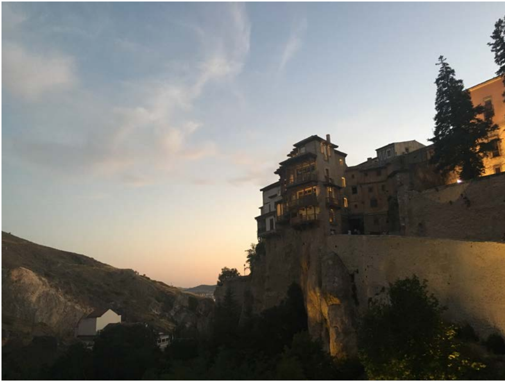
美麗的小鎮Cuenca，圖中建築為世界文化遺產「懸臂屋」