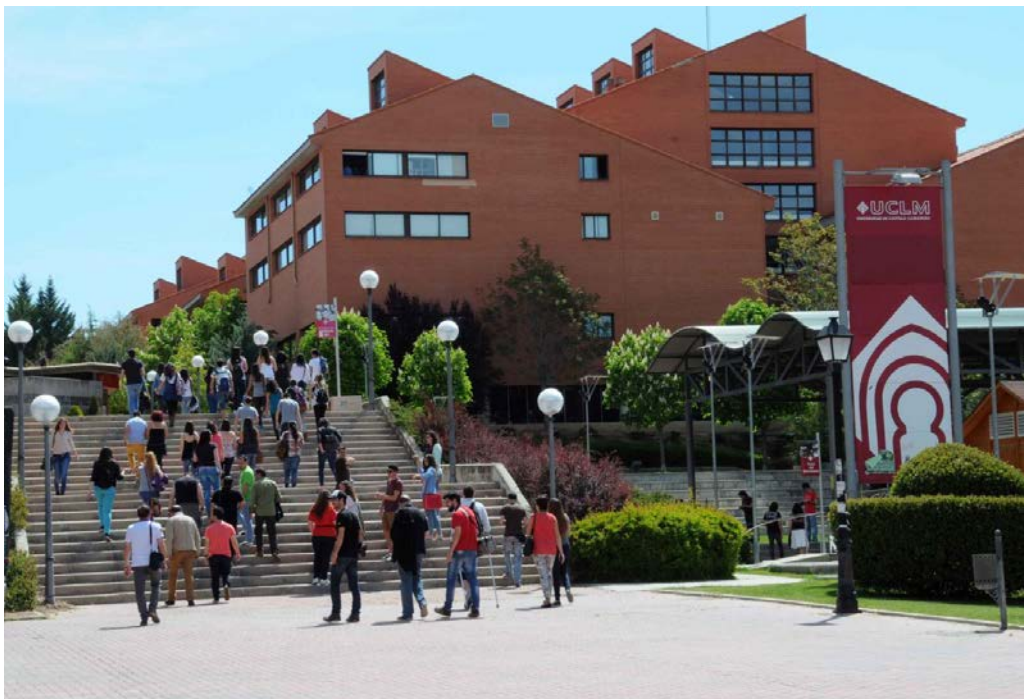
卡斯提亞拉曼查大學昆卡分校一校園環境

昆卡市坐落於西班牙中部，距離馬德里167公里，具有歷史但又現代化，由於其完善地保護了古城環境、中世紀城堡，以及12世紀到18世紀間豐富的宗教人文建築，再加上與周邊自然美景相融合，1996年12月7日被聯合國教育、科學及文化組織列入世界文化遺產。