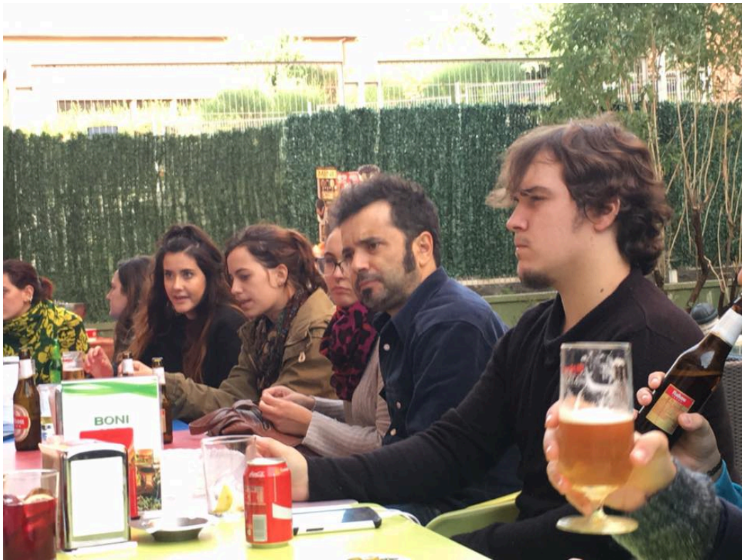
攝影課下課，和教授及同學到酒吧喝一杯!(和朋友聊天喝酒是西班牙人的習慣和娛樂)