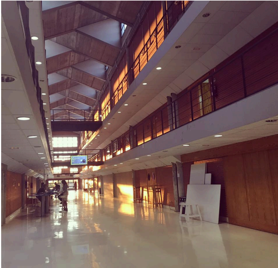
晚上七點美術系系館的長廊